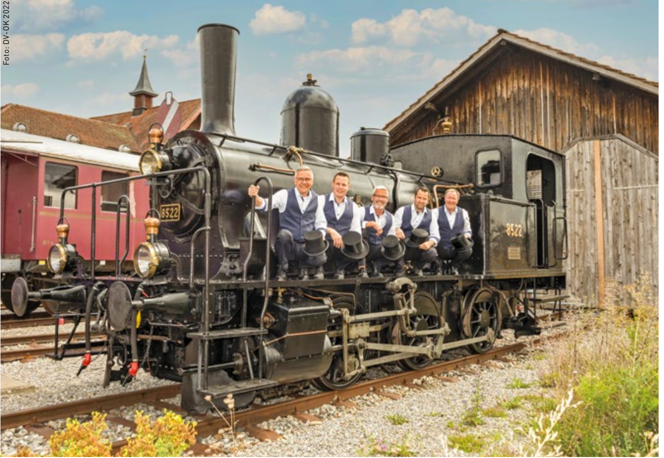
Il comitato organizzativo lucernese dell'AD 2022.