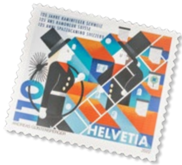
Busta primo giorno et francobollo speciale.